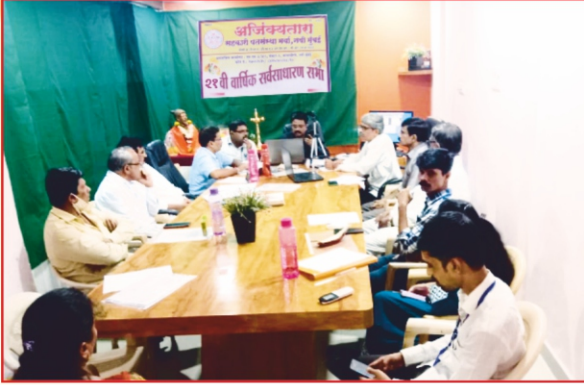
२१ व्या ऑनलाईन वार्षिक सर्वसाधारण सभेला उपस्थित संचालक मंडळ