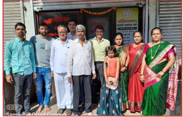
संस्थेचे संचालक मंडळ, कर्मचारी वृंद व दैनंदिन ठेव प्रतिनिधी वर्ग.