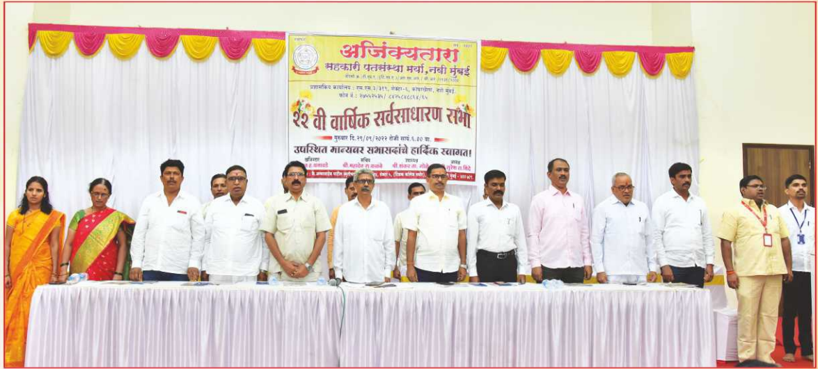
संस्थेच्या २२व्या वार्षिक सर्वसाधारण सभेप्रसंगी व्यासपीठावर उपस्थित संचालक मंडळ व मान्यवर.