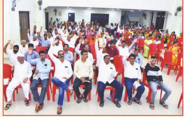
संस्थेच्या २२व्या वार्षिक सर्वसाधारण सभेस उपस्थित सभासद बंधु-भगिनी.